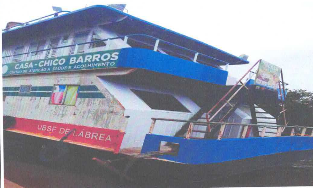
REFORMA E ADEQUAÇÃO DA UBS FLUVIAL CHICO BARROS. TRAVESSA NAZARÉ, BAIRRO CENTRO – LÁBREA/AM IMAGENS LATERAIS EXTERNA DA UBS CHICO BARROS.

ESTADO DO AMAZONAS PREFEITURA MUNICIPAL DE LÁBREA