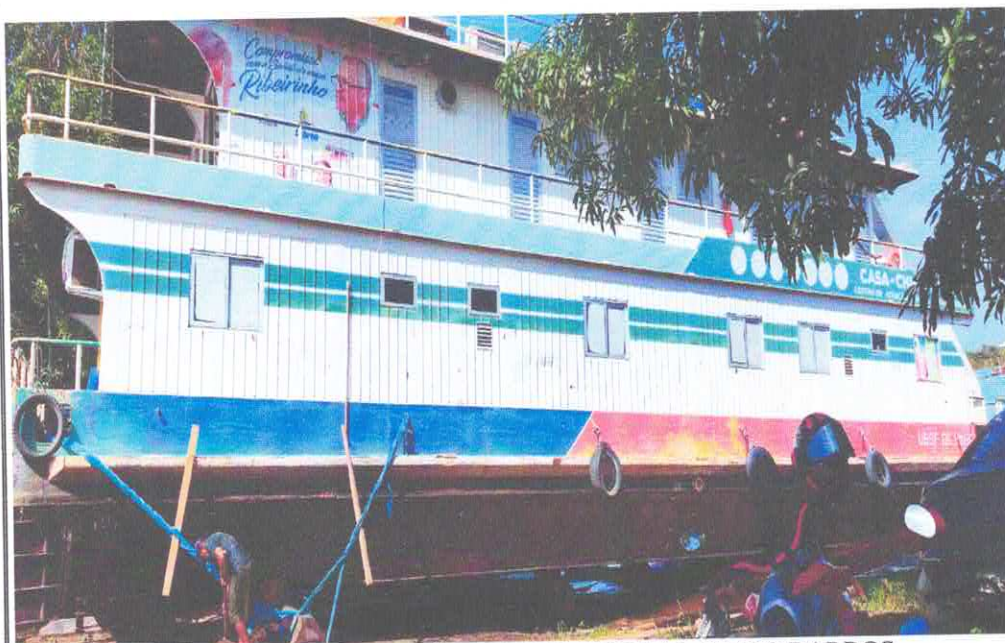
REFORMA E ADEQUAÇÃO DA UBS FLUVIAL CHICO BARROS. TRAVESSA NAZARÉ, BAIRRO CENTRO – LÁBREA/AM IMAGENS LATERAIS EXTERNA DA UBS CHICO BARROS.